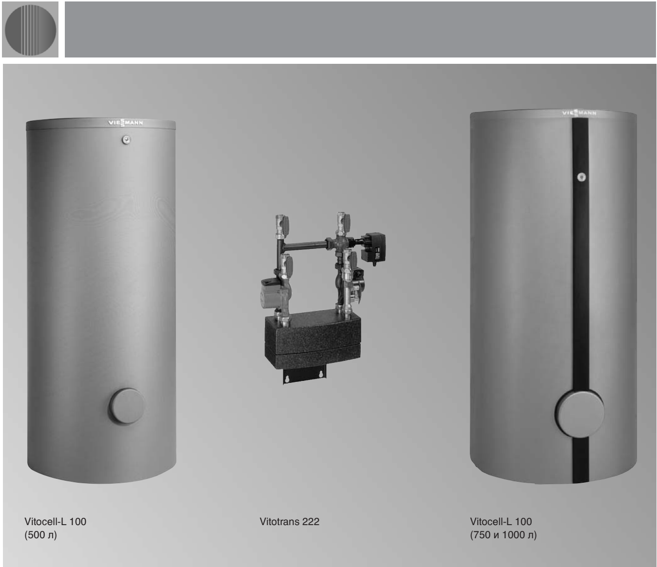
Vitocell-L 100 (500 л)

Емкостные водонагреватели для установок приготовления горячей воды в системе подпитки емкостного водонагревателя